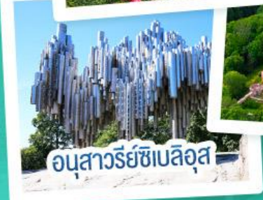
อนุสาวรีย์ซีเบลิอุส

ฟินแลนด์ - เอสโตเนีย - ลัตเวีย - ลิทัวเนีย แวะเที่ยวเซี่ยงไฮ้