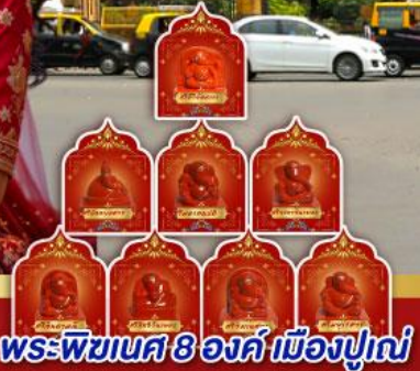
พระพิฆเนศ 8 องค์ เมืองปูณ