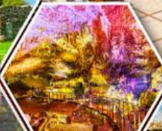
น้ำพุร้อนบิซูล