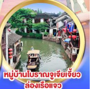
หมู่บ้านโบราณจูเจียเจี้ยว ล่องเรือแจว