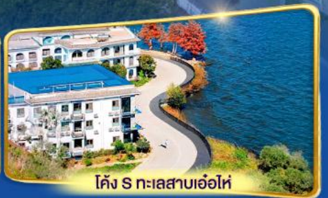
โค้ง S ทะเลสาบเอ้อไห่