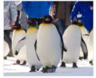
ชมพาเหรดแพนกวิน