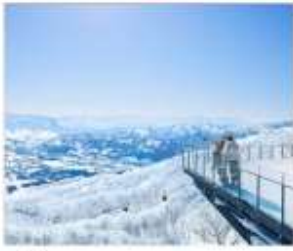
ชมวิวFOREST OF TREE