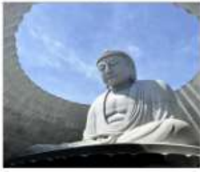
HILL OF BUDDHA