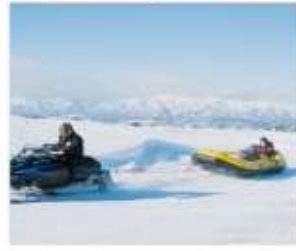
กิจกรรมบีโบสโนว์แลนด์