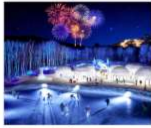
หมู่บ้านน้ำแข็งโทมามู