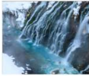
น้ำตกชิราอิเกะ