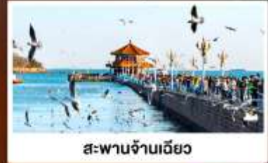
สะพานจ้านเฉียว