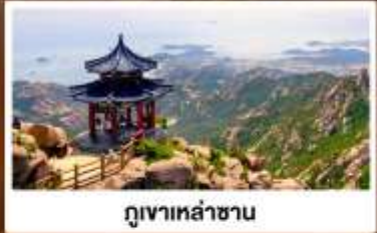
ภูเขาเหลาชาน