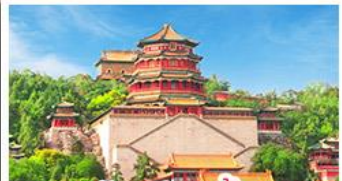
พระราชวังฤดูร้อนอ้อเหอหยวน