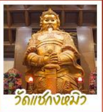
วัดเขงงเดมิว