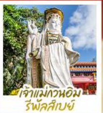
เจ้าแม่กวนอิม รพีลลาลัย