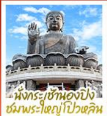
หังกระเชาองปิง ชมพระใหญ่ไป่หวล

นั่งกระเช้ามองปิงสีกการะพระใหญ่ไป่หวล • วัดหวังต้าเซียน ขอพรสุขภาพ ความรัก วัฒเขงหนิว ขอพรองค์เขงง โชคลาก การเงินและธุรกิจ • เจ้าแม่กวนอิมรพีลลาลัย ธิพพลังงานดี เสริมพลังฮวงจุ้ย • วัดมื่นไทมว ขอพรเรื่องการศึกษา การงาน สติปัญญาและความกล้าหาญ