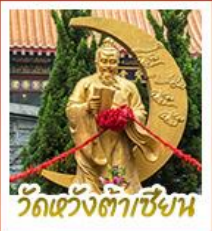
วัดเขงงต้าเซียน