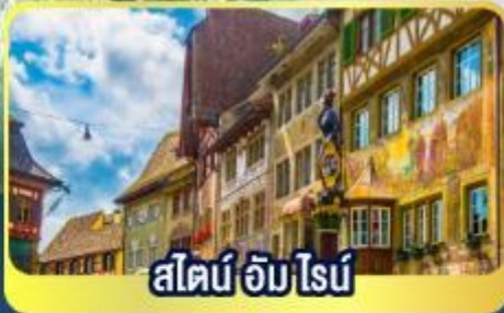
สไตน์ อัม ไนน์