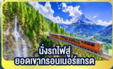
นั่งรถไฟสู่ ยอดเขารอนเนอร์เกรต