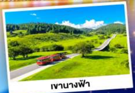
เจานางฟ้า