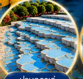
ปามุกคาล์ Pamukkale