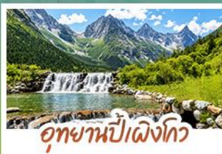
อุทยานปีเฉิงโกว