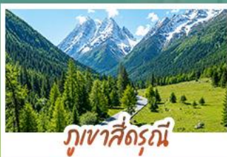
ภูเขาสี่ตรุนี