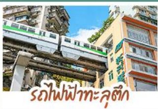
รถไฟฟ้าทะลุคอกหิมะ

ชมธรรมชาติ ณ อู่หลง ชมหุบเขาสุดอลังการระดับมรดกโลก นั่งรถไฟฟ้าทะลุคอกหิมะป่า สัมผัสกลิ่นเมืองฉิ่งสุดล้ำ สัมผัสวิถีภูเขาหิมะแห่ง ภูเขาสี่ตรุนี งดงามจนได้รับฉายา "เทือกเขาแอลป์แห่งตะวันออก" ชมธรรมชาติสุดฟิน ณ อุทยานปีเฉิงโกว • ซอยปิ้งจู่เจี๋ย ถนนคนเดินไท่กู่หลู่, ถนนคนเดินซุนชี่ลู่