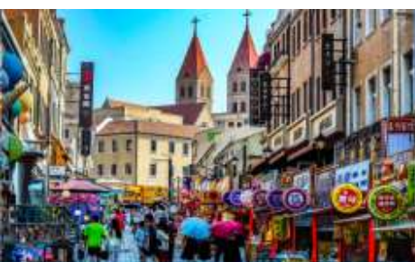
ถนนวงเวียน