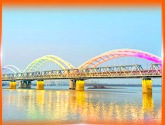
สะพานรถไฟฮาร์บิน