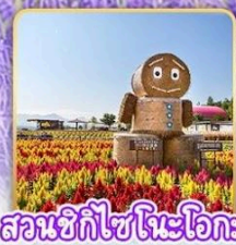
สวนซึกิไซโนะโอกะ