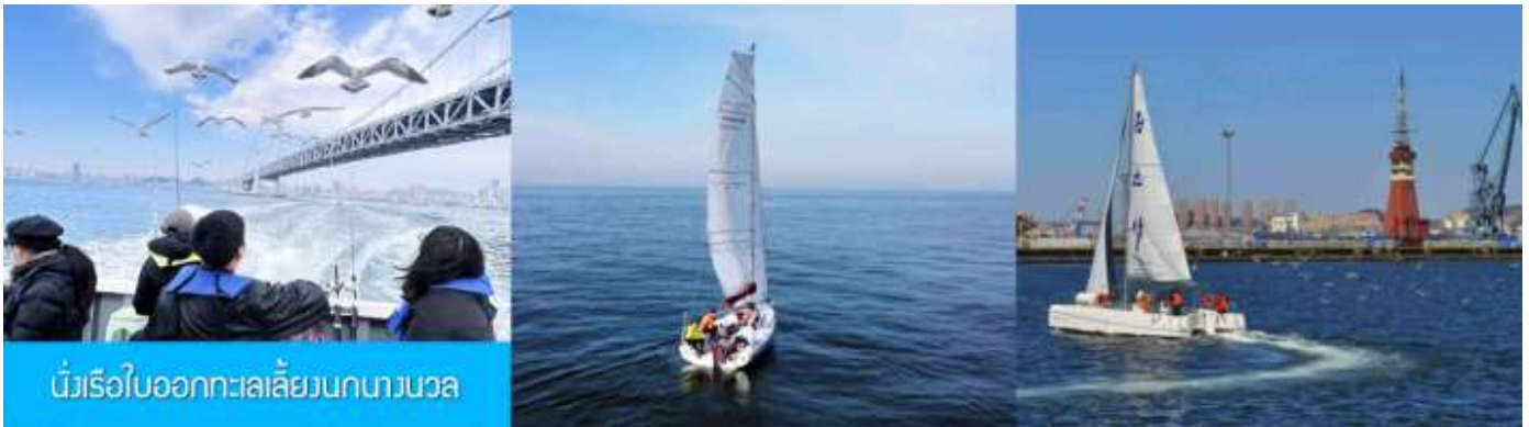
นั่งเรือใบออกทะเลเลี้ยงนกนางนวล

ไกด์นำเสนอโปรแกรมทัวร์เสริมหรือ OPTIONAL TOUR นั่งเรือใบออกทะเลเลี้ยงนกนางนวล ชมวิวชายฝั่งเมืองต้าเหลียน ใช้เวลาประมาณ 40 นาที + ขึ้นจุดชมวิวบนเขาดอกบัว (เหลียนฮั่วซาน) ชมทัศนียภาพแบบพาโนรามาของเมืองต้าเหลียน + ล่องเรือคอนโดล่าในสวนน้ำเวนิส อัตราค่าบริการท่านละ 500 หยวน หรือ 2,500 บาท อัตรานี้รวมค่าบัตร รถรับส่ง ค่าประกันอุบัติเหตุ และค่าบริการของไกด์ท้องถิ่น