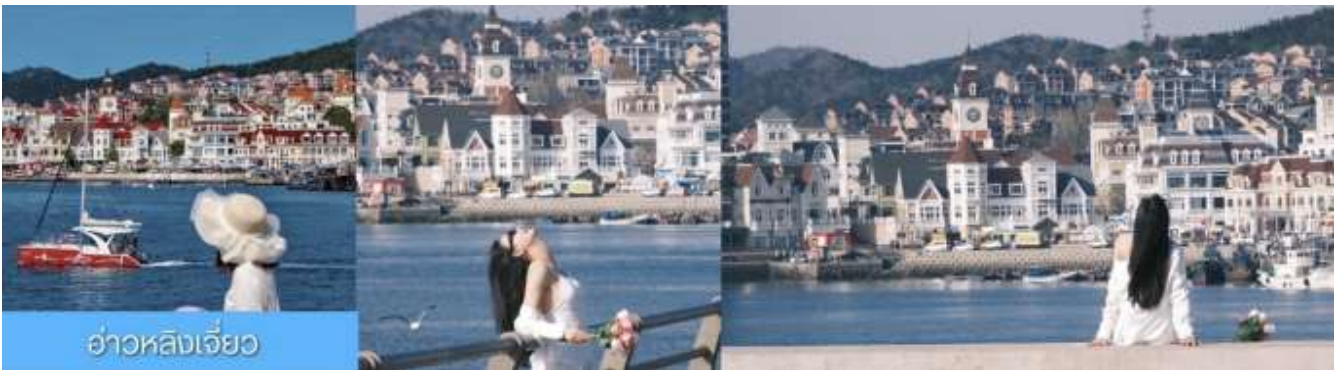
อ่าวหลิงเจี้ยว

จากนั้นนำท่านเที่ยวชม ท่าเรือประมงหู่กาน 大连渔人码头 เป็นจุดเช็คอินที่โดดเด่นด้วยสถาปัตยกรรมสไตล์ยุโรปสีสันสดใส ผสมผสานกลิ่นอายเมืองท่าดั้งเดิมเข้ากับบรรยากาศสุดโรแมนติกที่เต็มไปด้วยเรือประมง คาเฟ่ ร้านอาหาร และจุดชมวิวยุริมาทะเล