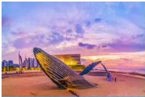
ประติมากรรม วาฬโด้ดเดี่ยว

05.30 น. เรือท่องเที่ยวขนาดคณะเดินทางถึงท่าเรือเมืองเยียนไถ นำท่านขึ้นรถบัสเพื่อเดินทางสู่ตัวเมืองเยียนไถ เช้า รับประทานอาหารเช้า ณ ห้องอาหารของโรงแรม (7) หลังอาหารนำท่านเที่ยวชม ท่าเรือชาวประมงไห่ซาง 烟台海昌鱼人码头 ท่าเรือนี้เต็มไปด้วยสถาปัตยกรรมสไตล์อเมริกันเหนือ และยุโรป ให้ท่านได้สัมผัสและเก็บภาพบรรยากาศที่แสนโรแมนติกริมทะเล ที่มีอาคาร