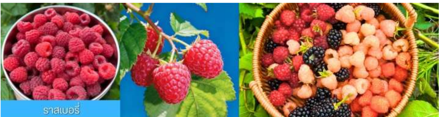
ราสเบอร์รี่