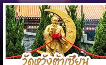
วัดเซว้งต้าเซียน