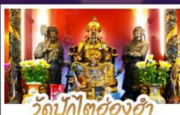
วัดปึกไค้อ่งฮ่า

นั่งกระเช้าแองปิงสักการะพระใหญ่เทียนถาน • ขอพรองค์เซกง โชคลาก การเงินและธุรกิจ เทพเจ้าปึกไค้อ่งฮ่า ขอพรเรื่องความสำเร็จในชีวิตและการทำงาน • วัดหวังต้าเซียน สักการะสิ่งศักดิ์สิทธิ์ เสริมมงคลชีวิต • เจ้าแม่ทวนอิมอ่องฮ่า ขอเรื่องเงิน ทรัพย์สิน และความมั่งคั่ง • อิศระท่องเที่ยว 2 วัน เสือช้อปมิตรคิสมีย์แลนด์หรือช้อปบั้งจ๊อง