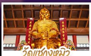
วัดเซกกงเซมว