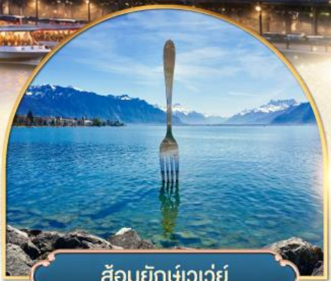
ส้อมยักเข่าเวว้ย