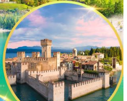
ซีร์มิโอเน