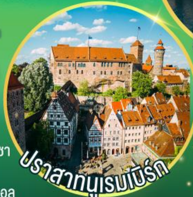
ปราสาทบูเรนเบิร์ก