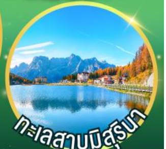
ทะเลสาบบิสุงนา