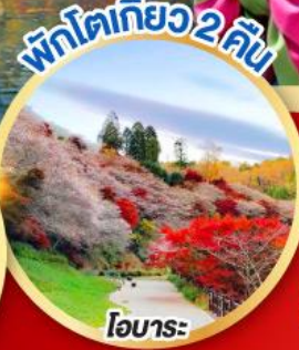
พักโตเกียว 2 คืน