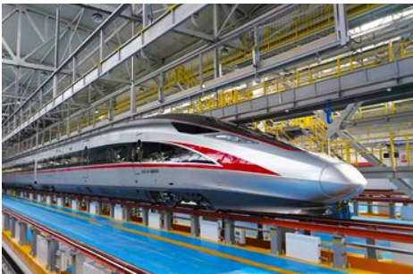
บิวรถไฟความเร็วสูง