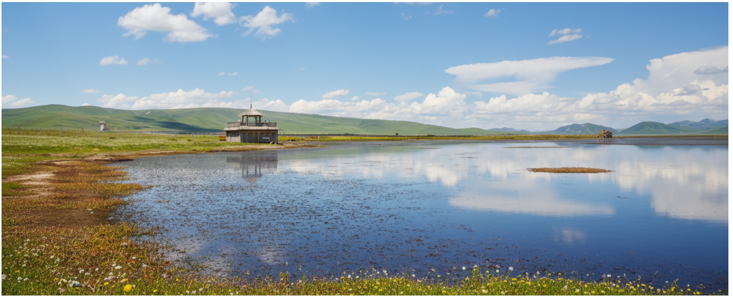
กลางวัน รับประทานอาหารกลางวัน ณ ภัตตาคาร (เมื่อที่ 17)

ขจี อากาศที่นี่บริสุทธิ์และบางเบา มีเพียงเสียงลมที่พัดผ่านยอดหญ้าและเสียงนกน้ำที่ขับขานเป็นท่วงทำนองแห่งธรรมชาติ บรรยากาศอันเงียบสงบจะชะล้างความเหนื่อยล้าให้หมดสิ้นไปในทันที ทะเลสาบแห่งนี้ไม่ได้เป็นเพียงความงดงามทางสายตา แต่ยังเป็นพื้นที่ชุ่มน้ำอันอุดมสมบูรณ์และมีความสำคัญยิ่งต่อระบบนิเวศบนที่ราบสูงทิเบต ถือเป็นแหล่งพักพิงและสวรรค์ของเหล่ากอพยพนานาชนิด โดยเฉพาะอย่างยิ่ง "นกกระเรียนคอดำ" สัตว์ปีกสง่างามอันเป็นสัญลักษณ์แห่งความสุขและอายุยืนยาวในวัฒนธรรมทิเบต ในช่วงฤดูร้อนทุ่งหญ้ารอบทะเลสาบจะผลิดอกไม้ป่านานาพรรณ กลายเป็นภาพวาดสีสันสดใสที่ธรรมชาติรังสรรค์ขึ้น เชิญท่านทอดน่องไปตามสะพานไม้ที่ทอดยาวเหนือผืนน้ำ สูดอากาศอันแสนสดชื่นให้เต็มปอด พร้อมเก็บภาพความประทับใจของผืนน้ำจรดขอบฟ้า ที่ซึ่งฝูงปศุสัตว์ของชาวทิเบตพื้นเมืองกำลังเล็มหญ้าอย่างอิสระอยู่ไกลๆ