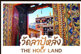
วัดลาปูหลง THE HOLY LAND

หนึ่งศรัทธา: สัมผัสความสงบและสถาปัตยกรรมทิเบตที่ วัดลาปูหลง หนึ่งผืนหญ้า: ล่องลอยไปในความเขียวจีของทุ่งหญ้าชางเคอ หนึ่งสายน้ำ: ค้นพบความงามเหนือกาลเวลาที่ จิวจ้ายโกว