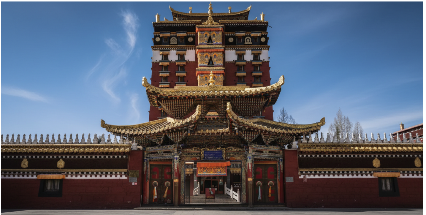
บ่าย นำท่านเดินทางสู่ หอพระมิลารปะ (ระยะทาง 134 ก.ม. ใช้เวลาเดินทางประมาณ 2 ชั่วโมง) สู่ใจกลางศรัทธา หอพระ 9 ชั้น มิลารปะ สถาปัตยกรรมทางพุทธศาสนาที่น่าอัศจรรย์ใจและเป็นหนึ่งเดียวใน