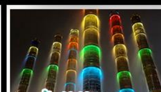
น้ำพุไม้ไผ่ตึกSKP