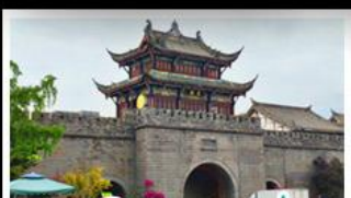
เมืองโบราณกวนเซี่ยน

ภูเขาสี่ดรุณี - อุทยานป่ฝิงโกว - สะพานหมานเฉียว - ร้านหนังสือจงซูเก๋อ - เมืองโบราณกวนเสี้ยน จดรัสหย่างเทียนหวู่ - หมีแพนด้าเซอเฟี - ถนนโบราณชอยกวางชวยแคบ - ถนนคนเดินไท่กู๋หลี่ ถนนคนเดินซุนซี - ถนนโบราณจินหลี่ - แพนด้ายักษ์ปิ่นตึก - น้ำพุไม้ไผ่ตึกSKP - วัดต้าอ้อ