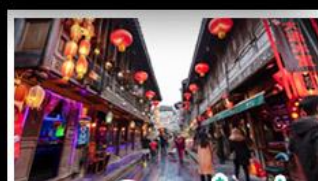
ถนนโบราณจินหลี่