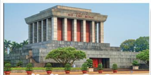
จัตุรัสบาติงห์