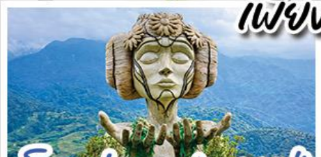
ไมอาน่า ซาปา ดาเฟ้