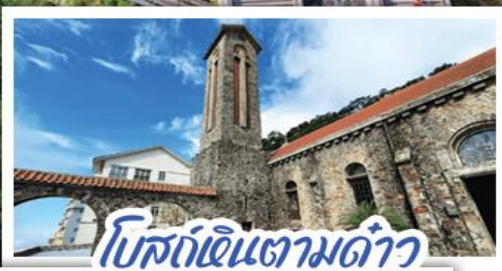
โบสถ์หินตามด้าว