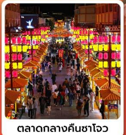
ตลาดกลางคีนซาโจว