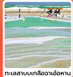
ทะเลสาบเกลือจาเอ้อหนาน