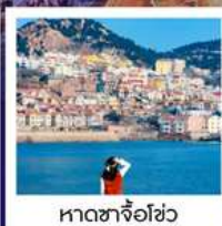
หาดซาโจฮั่ว