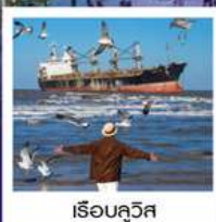
เรือบลูวิส