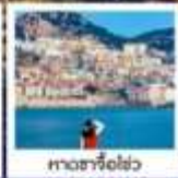
หาดซาโจอ่าว