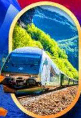
รถไฟฟลัมสนามา