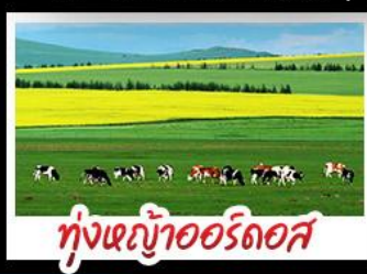
ทุ่งหญ้าเออร์ดอส

ทุ่งหญ้าเออร์ดอส สุสานเจกีสถาน แกรนด์แคนยอนแม่น้ำเหลือง