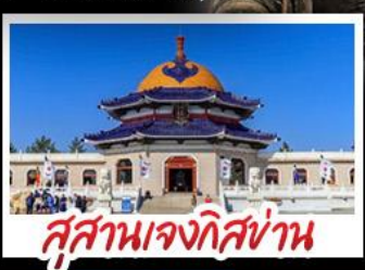
สุสานเจกีสถาน