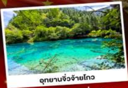
อุทยานจิ่งเจียงโกว