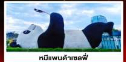
หมีแพนด้าเซลฟี่