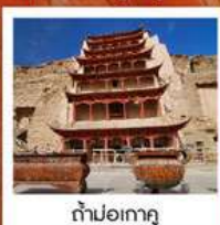
ท่าม่อเกา