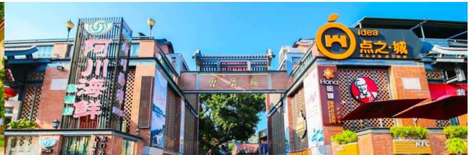
หมู่บ้านชาวประมง เจิงจ้าวอัน