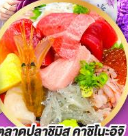
ตลาดปลาฮิมิสึ คาชิโมะจิ

ถ่ายรูปเชคอินวิวฟูจิ กับซุ้มประตูโทเซคิจิ แซนมอน อิสระท่องเที่ยว ช้อปปิ้งหนึ่งวันเต็มในโตเกียว