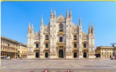
ซอปป์ิงจู่ที่มีลาน