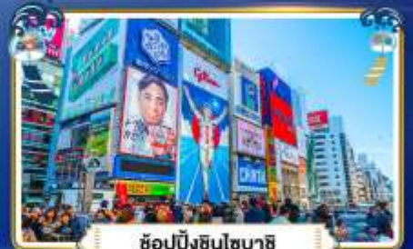
ช้อปปิ้งชินโซบาสึ