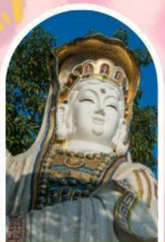
ริพลัสเบย์ รับพลังงานดี เสริมพลังดวงจัญ