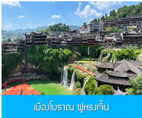
เมืองโบราณ ฝูหรงเจิน

จากนั้นนำท่านเดินทางสู่เมืองฝูหรงเจิน นำท่านเที่ยวชม เมืองโบราณ ฝูหรงเจิน 芙蓉古镇 เมืองโบราณเก่าแก่ขึ้นชื่อของมณฑลหูหนานที่โด่งดังจาก ภาพยนตร์เรื่อง ฝูหรงเจิน เป็นสถานที่ท่องเที่ยวระดับ 4A ที่ได้รับความนิยมจากนักท่องเที่ยวคู่กับเมืองโบราณฟงหวง เป็นสถานที่หลักในการถ่ายทำภาพยนตร์เรื่อง ฝูหรงเจิน ทำให้สถานที่แห่งนี้ยังได้รับความนิยมจากนักท่องเที่ยว จุดไฮไลท์ของเมืองโบราณแห่งนี้ นอกจากบ้านเรือนโบราณสวยเก๋ที่เป็นเอกลักษณ์เฉพาะของมณฑลหูหนาน ที่ยังมีน้ำตกขนาดใหญ่ที่สวยงามกลางเมืองที่เป็นจุดเช็คอิน