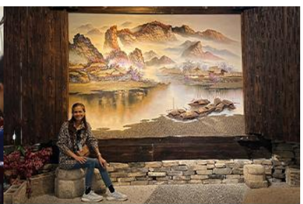
พิพิธภัณฑ์ภาพถ่ายเขียนหินทราย

วันที่สี่ เมืองจางเจียเจีย- ศูนย์ผลิตภัณฑ์หยก –ร้านใบชา – พิพิธภัณฑ์ภาพถ่ายเขียนหินทราย-ไกด์นำเสนอโปรแกรมเสริม สะพานกระจกแกรนด์แคนยอน- เมืองหยี่ซาง