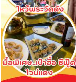
มือพิเศษ...เป่าฮ้อ ซิฟู๊ด ไวน์แดง