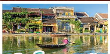
เมืองโบราณเฮอฮอัน

! พักบนเขานาฮิลล์ 1 คืน ! สัมผัสอากาศเย็นตลอดปี สตรีตฝรั่งเศสสุดคลาสสิก - นั่งกระเช้ายาวที่สุด สู่มานาฮิลล์ สนุกสุดมันส์ไปกับสวนสนุก The Fantasy Park รมีสการเจ้าแม่กวนอิมองค์ใหญ่ที่สุดของเมืองดานัง - เช็กอินเมืองมรดกโลกฮอยอัน - สนุกสนานไปกับกิจกรรม!! นั่งเรือกระดิง หมู่บ้านกัมถาน เช็กอินร้านกาแฟ SON TRA MARINA CAFE - ไม่ลงร้านช้อปปิ้ง - อิ่มอร่อยกับบุฟเฟ่ต์นานาชาติ , หม้อไฟซีฟู้ด