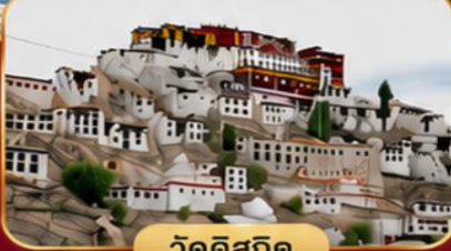
วัดดิสกิด