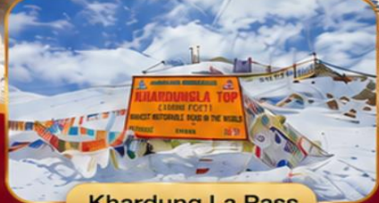
Khardung La Pass