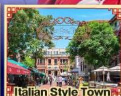
Italian Style Town