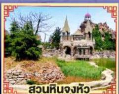
สวนหินจงหลิว