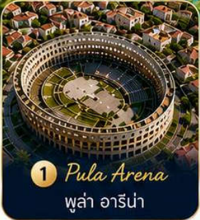
1 Pula Arena พูล่า อารีน่า