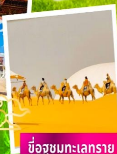
ขั้วอูฐทะเลทราย