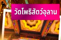
วัดโพธิ์สัตว์อูลาน