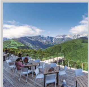
“HAKUBA MOUNTAIN HARBOR”

นำท่านไปโอบกอดธรรมชาติที่ครบครันในที่เดียว “คามิโคจิ” สวิสเซอร์แลนด์แดนญี่ปุ่นเทือกเขาที่ปกคลุมด้วยหิมะสวยงาม ชมความงามของ “ทุ่งพืชมอส ฟุจิชิบะซากุระ” มนต์เสน่ห์..พรมธรรมชาติสีชมพูหลากสีสดใส เปลี่ยนอริยาบท “จันทรະเข้าฮาคุบะ อิวะตะกะ” เพื่อชมวิวพาโนรามาของเทือกเขาแอลป์ญี่ปุ่นกันให้อิ่มใจ สัมผัสกลิ่นอายเมืองเก่า “เมืองทาคายามา” ที่ยังคงอนุรักษ์ความเป็นอยู่ เมื่อสมัยเอโดะกว่า 300 ปี สายช้อปปิ้งห้ามพลาด “คารุอิซาวะ เอ้าท์เล็ต” แลนด์มาร์กของเมืองคารุอิซาวะ และ “ย่านชินจูกุ” แห่งเมืองโตเกียว ชมความงามกับเส้นทาง “เจแปนแอลป์ (กำแพงหิมะ)” สุดยอดของการท่องเที่ยวที่ถูกขนานนามว่า “หลังคาแห่งญี่ปุ่น”