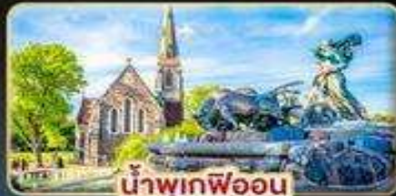
น้ำพุเกฟออน