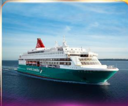
เรือสำราญ GO NORDIC CRUISE LINE