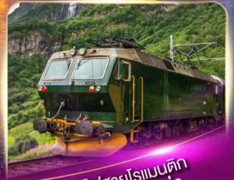
รถไฟสายโรแมนติก ฟลัมส์บาน่า