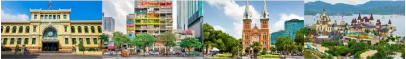
ไบรณีย์กลางโฮจิมินห์