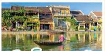
เมืองโบราณเฮองอัน

! พักบนเขาบาน่าฮิลล์ 1 คืน ! สัมผัสอากาศเย็นตลอดปี สไลด์น้ำเร็วสุดคลาสสิก - นั่งกระเช้ายาวที่สุด สูบานาฮิลล์ สุกสุดมันส์ไปกับสวนสนุก The Fantasy Park นมัสการเจ้าแม่กวนอิมองค์ใหญ่ที่สุดของเมืองดานัง - เช็กอินเมืองมรดกโลกฮอยอัน - สนุกสนานไปกับกิจกรรม!! นั่งเรือกระดิง หมู่บ้านกัมทาน เช็กอินร้านกาแฟ SON TRA MARINA CAFE - ไม่หลงร้านช้อปปิ้ง - อิ่มอร่อยกับบุฟเฟ่ต์นานาชาติ , มื้อไฟซ์ฟู้ด