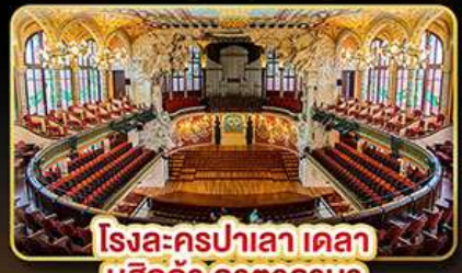
โรงละครปาลาเดอเลอา มุสิก้า คาคาลานา