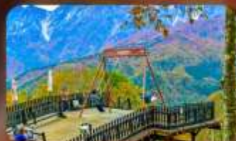
ฮาคุบะ-อิวกากะ