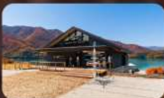
AO Lakeside Cafe'